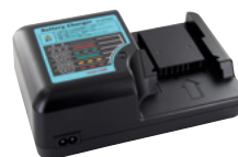
E Carica Batterie (BC2075MX)