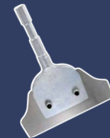
Schaber 200 mm 4313508