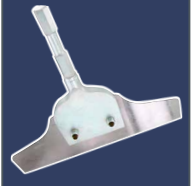
Schaber 300 mm 4313512