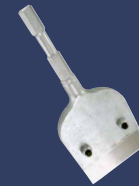
Schaber 100 mm 4313504