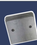
5-er Pack Blätter, 100 mm 4393504