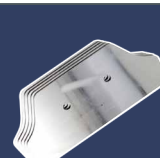
5-er Pack Blätter, 200 mm 4393508