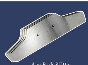
4-er Pack Blätter, 300 mm 4393512