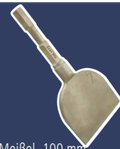
Meißel, 100 mm Aluminium-Bronze 7051112