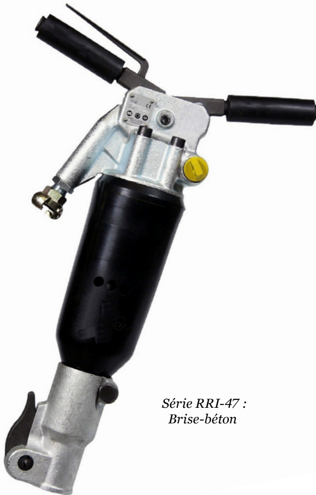
Série RRI-47 : Brise-béton

Ce marteau de démolition de RED ROOSTER INDUSTRIAL est équipé d'un porte-burin à cliquet. Idéal pour une utilisation longue durée. Puissance de frappe élevée. Pour les applications dans la construction et la rénovation de bâtiments.