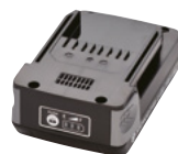
Batterie 18V 2 AH (BPL-1820)