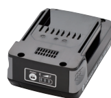
Batteria 18V 2 AH (BPL-1820)