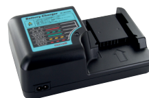
E Carica Batterie (BC2075MX)