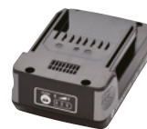
Batterie 18V 2 Ah (BPL-1820)