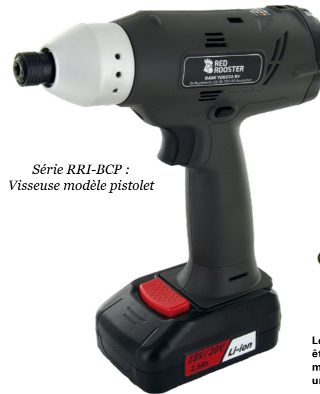
Série RRI-BCP : Visseuse modèle pistolet