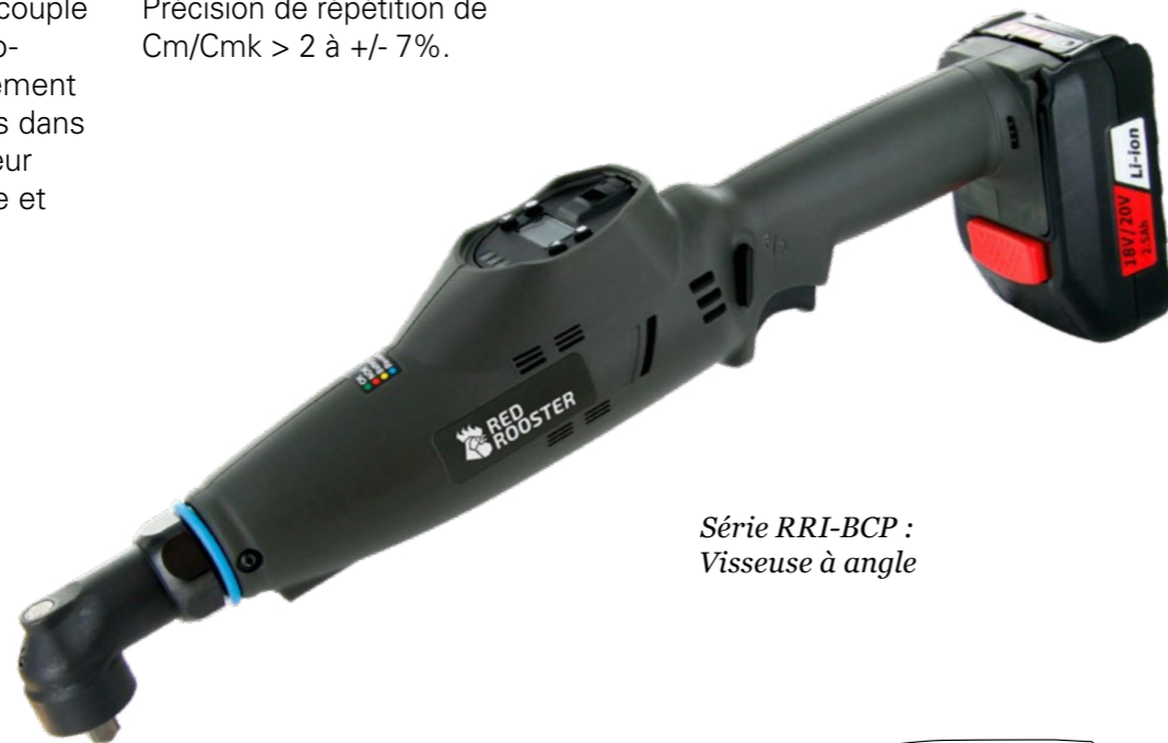
Série RRI-BCP : Visseuse à angle

Les programmes peuvent être sélectionnés simplement ou programmés dans une séquence fixe.