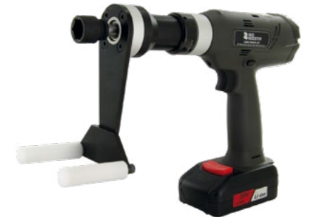
RRI-BCPW50RA - Cet outil spécifique a été développé pour l'industrie du vélo, montage pédalier.

Les programmes peuvent être sélectionnés simplement ou programmés dans une séquence fixe.