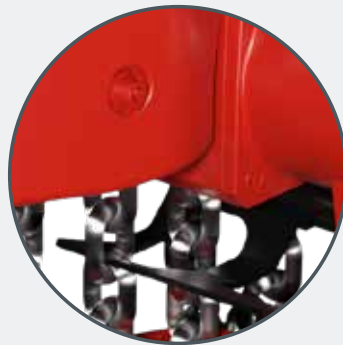
BUTÉE MÉCANIQUE DE FIN DE COURSE