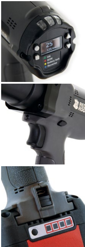
Verschraubungsdaten über USB Schnittstelle abrufbar.

Die Serie der Red Rooster RRI-BEC Akku-Hochmomentschrauber ist sehr gut geeignet für Montageanwendungen, bei denen eine gute Drehmomentgenauigkeit erforderlich ist. Die Gesamtreichweite des Drehmomentbereichs beträgt 50 ~ 4000 Nm, also Schrauben- größen M10 bis M45.