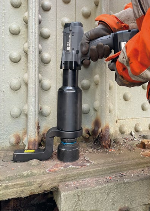
Lösen von korrodierten Schrauben für die Bauindustrie.

IHR WERKZEUG FÜR DIE ANWENDUNG IHRER WAHL ANPASSEN Es ist eine Vielzahl von Reaktionsstangen und Halterungen erhältlich, aber wenn Sie eine maßgeschneiderte Reaktionsstange benötigen, können Sie die 3D-CAD-Zeichnungen mit uns teilen.