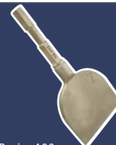
Burin, 100 mm Aluminium-Bronze 7051112