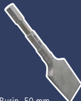
Burin, 50 mm Aluminium-Bronze 7051100