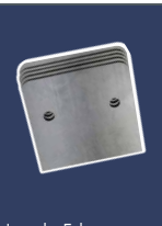
Jeu de 5 lames, 100 mm 4393504