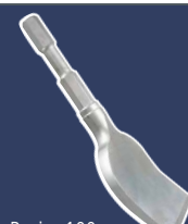
Burin, 100 mm coudé 7052102