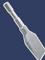
Burin, 52 mm 7051106