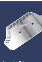
Jeu de 5 lames, 200 mm 4393508