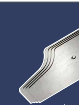
Jeu de 4 lames, 300 mm 4393512