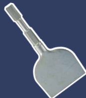
Burin, 100 mm 7051102