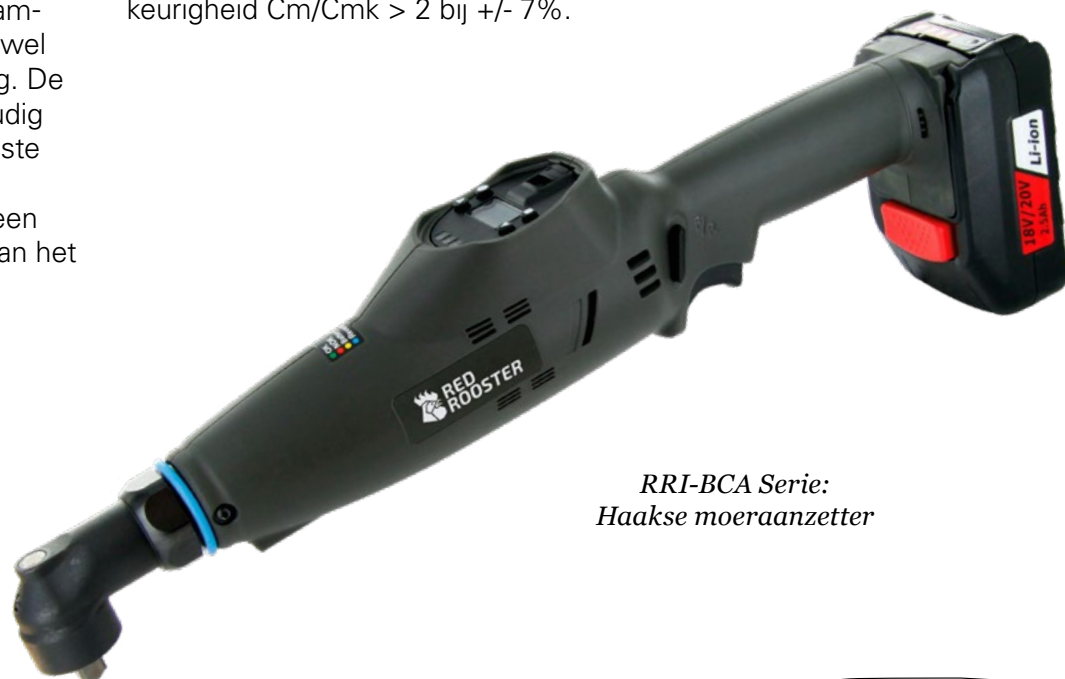
RRI-BCA Serie: Haakse moeraanzetter

Programma's kunnen eenvoudig worden geselecteerd of in een vaste volgorde worden geprogrammeerd.