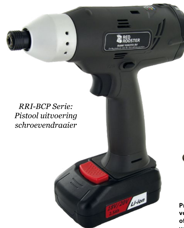
RRI-BCP Serie: Pistool uitvoering schroevendraaier